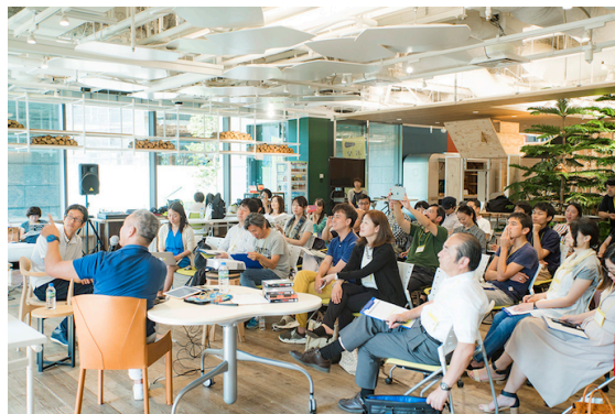
※トークショーのイメージ