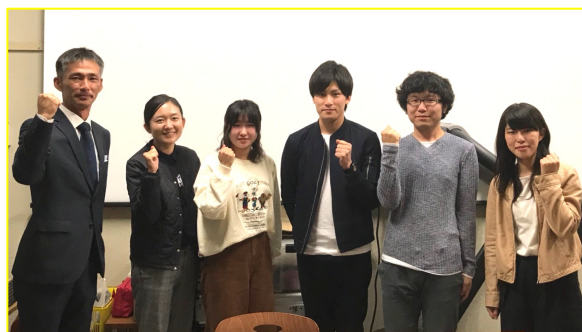
※新潟県警とNUTSメンバーたち